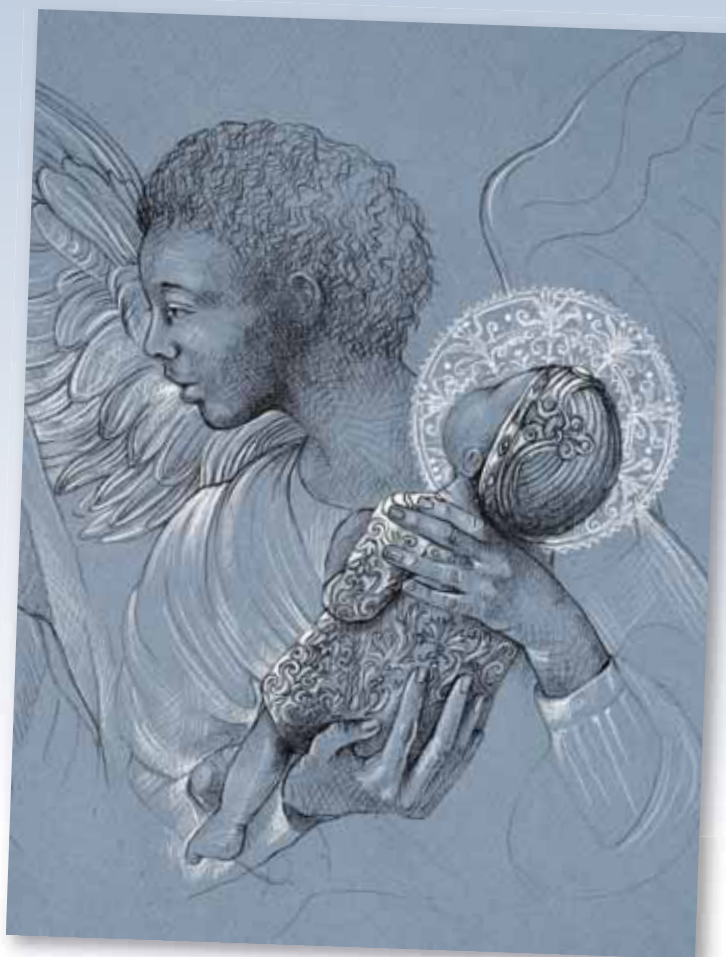
L'ange Gabriel présente le projet de Dieu-enfant à Marie. Dessin à la pierre noire d'Anne-Marie Forest.

Dieu, après avoir créé les êtres humains, chercha par tous les moyens possibles de gagner leur cœur. D'abord, il s'occupa de créer chacun et chacune, seconde par seconde: autrement ils seraient tous retournés au néant. C'est évident! Comme nous savons tous, la création n'est pas comme si Dieu nous donnait une chiquenaude initiale, et nous laissait aller par le moyen de nos propres forces; c'est bien plus comme si Dieu nous soufflait constamment dans l'existence, comme fait un enfant quand il gonfle un ballon. Si bien que si Dieu retenait son souffle pour une fraction de seconde, ce serait la fin de notre existence! Ainsi, comme je disais, Dieu continua à donner la vie aux humains. Mais il fit beaucoup plus que cela: il insuffla en eux un instinct social pour les amener à rechercher les autres et à éviter la solitude; il s'attrista avec eux quand ils étaient tristes et se réjouit avec eux quand ils se réjouissaient. Bref, il s'efforça par tous les moyens de gagner leur affection par sa bonté. Hélas, il échoua misérablement dans tous ses efforts. Le seul résultat qu'il récolta de ses peines fut que bien des humains en eurent peur; d'autres le détestèrent, et seule une poignée montra quelque amour réel pour lui.