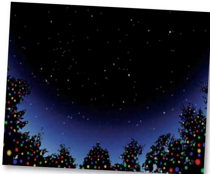
Ciel étoilé, univers familier des bergers.

Il vit alors un groupe d'hommes qui pointaient du doigt une région spécifique du ciel, quelque part entre les constel-