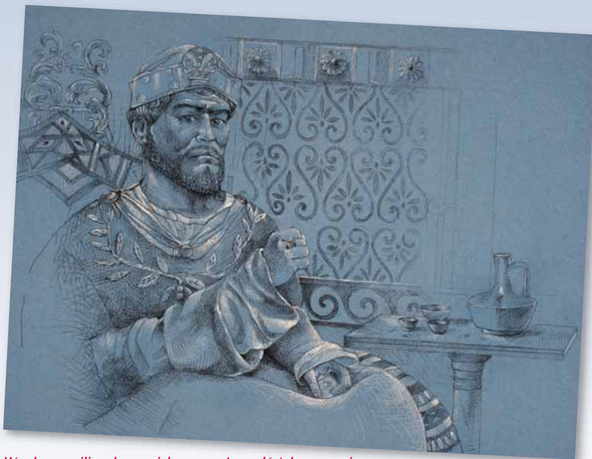
Le roi Hérode, au milieu de ses richesses, est appelé à la conversion...