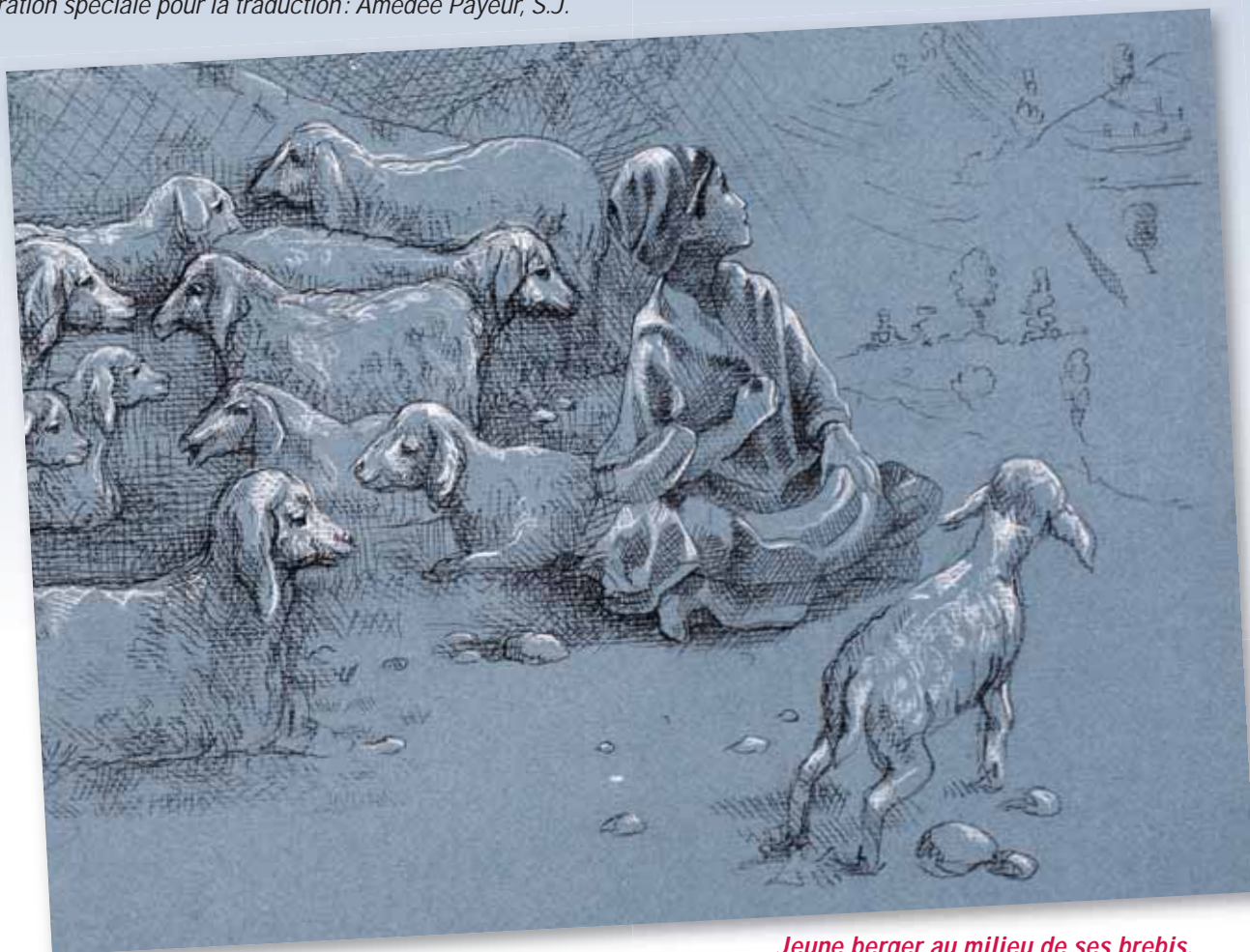
Jeune berger au milieu de ses brebis.