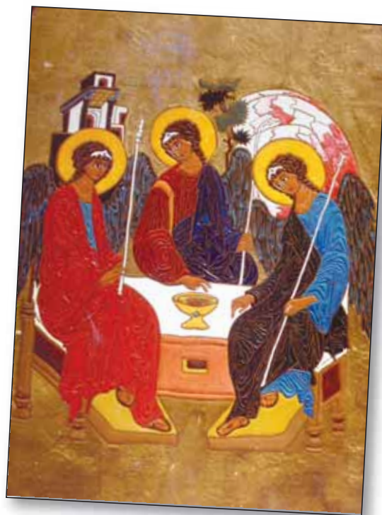
La Trinité, icône d'Andrei Roublev, moine du 14 e siècle.

« Eh bien, Seigneur, répondit l'ange, je ne peux ici que lancer une hypothèse: la voici. Chez les humains, le pouvoir est en général très mal utilisé. Voyez ce qu'il devient dans les mains des méchants et des égoïstes. Ainsi, et ça n'est pas une surprise, le pouvoir est détesté. S'il n'est pas détesté, il est craint, même quand on s'en sert avec amour. Les humains vont plus facilement aux enfants dans le besoin qu'aux maîtres débonnaires. Ainsi, Seigneur, dans leur relation avec vous, les humains ont la même