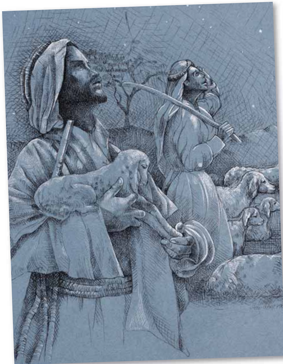
Les bergers regardent vers le ciel.